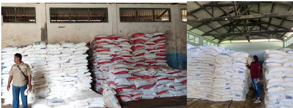
Gambar 3 Kondisi Penyimpanan Barang Di Gudang Kebun PT Surya Agrolika Reksa

Berikut ini kondisi penyimpanan barang di Gudang kebun PT. Surya Agrolika Reksa :