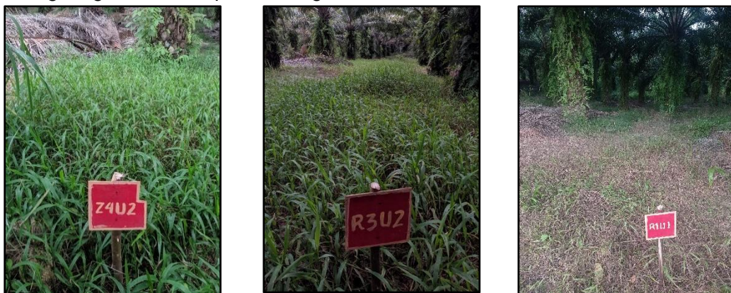
Gambar 1. Hasil Pengamatan Kecepatan Tingkat Kematian Gulma

Untuk mengetahui kecepatan tingkat kematian gulma maka dilakukan pengamatan secara langsung. Hasil terdapat dalam gambar 1.