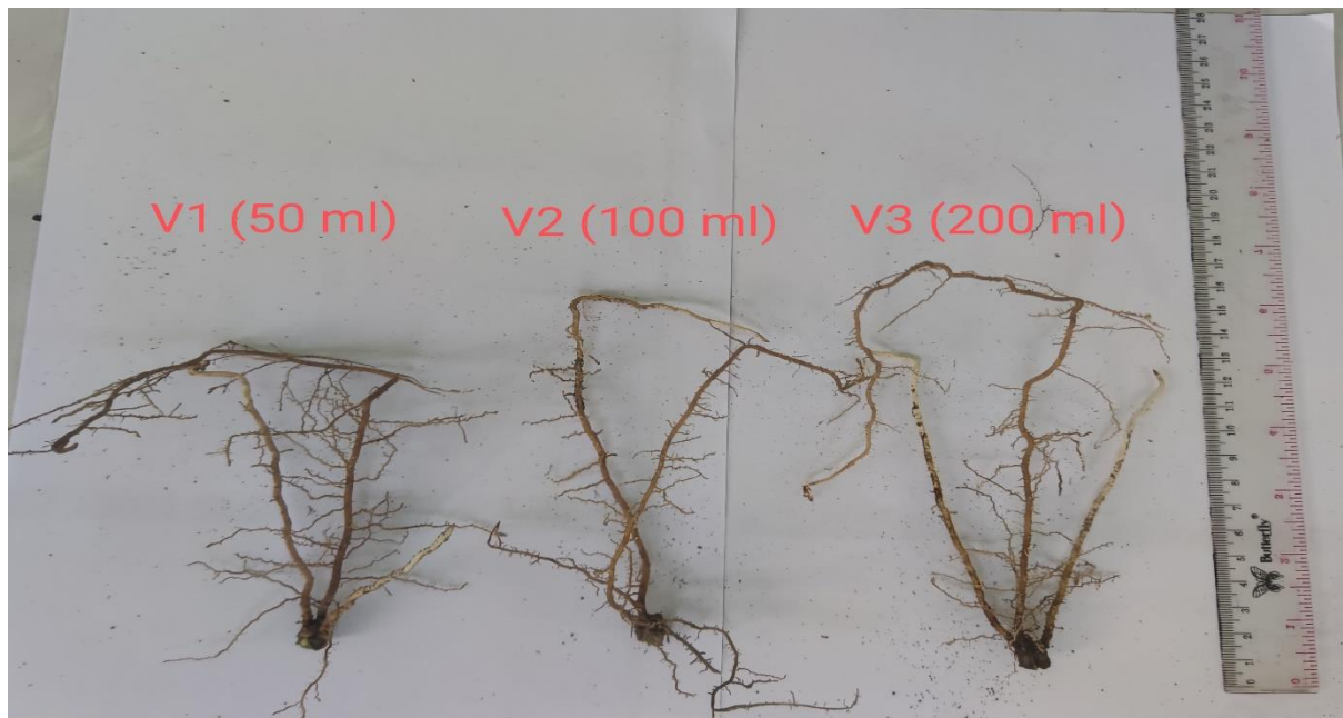
Gambar 2. Bentuk perakaran bibit kelapa sawit di pre nursery pada volume penyiraman.