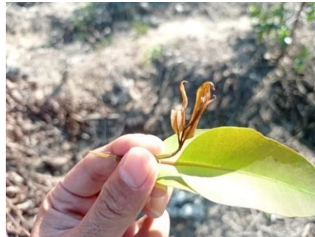
Gambar 1. Tanaman yang terserang Hama Pachypeltis sp.

Hasil dari analisis penelitian ini adalah penurunan insidensi dan penurunan severitas serangan hama Pachypeltis sp. pada tanaman Eucalyptus pellita umur 24 minggu setelah aplikasi insektisida dengan bahan aktif merk Fastac menggunakan alat fogger pada berbagai waktu fogging dan waktu pengamatan. Pengamatan dilakukan selama 1 bulan dan terdapat pengamatan sebelum dilakukan pengaplikasian di Compartment N034, Estate Nagodang.