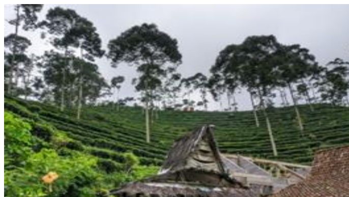
Gambar 1. Daya Tarik Agrowisata Kebun Teh

Agrowisata kebun teh Tritis masuk dalam beberapa wisata unggulan yang terdaftar dalam paket wisata yang ada di desa wisata widosari sehingga memudahkan pengunjung dalam mengakses wisata yang akan dikunjungi. Paket wisata yang disediakan meliputi wisata alam, wisata budaya, dan wisata edukasi.