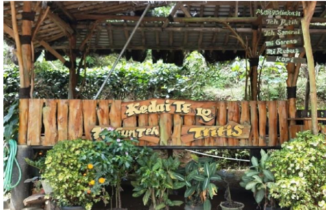
Gambar 3. Fasilitas Kedai Teh